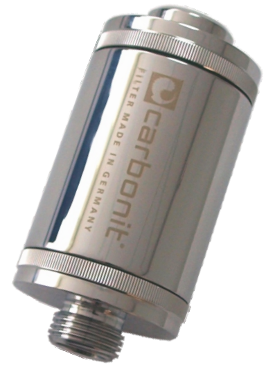
Standardanschlüsse 1/2"- Gewinde